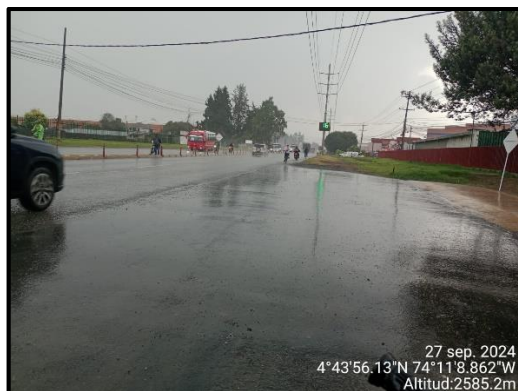
Ilustración 2. Evidencia recorrido, punto 1

Adicional a ello, en los puntos 1 y 3 no se evidenciaron anomalías que afecten el componente ambiental propio del recorrido de control y vigilancia en la vereda La Isla, como se observa en las siguientes ilustraciones: