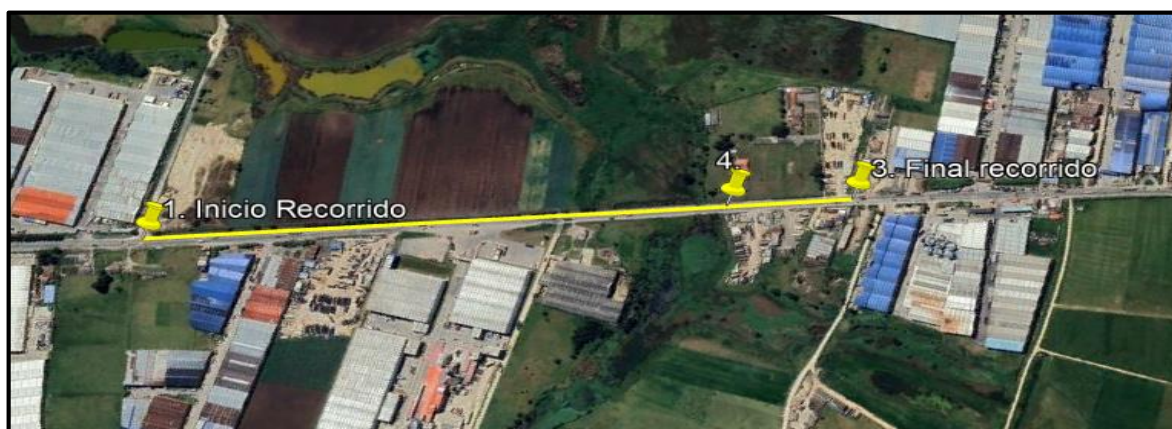
Ilustración 1. Recorrido de control y vigilancia en la vereda La Isla.

Con base en lo anterior, el día 27 de septiembre de 2024 se realizó recorrido de control y vigilancia en la vereda La Isla desde las coordenadas 4°43'56.13"N – 74°11'8.862"O hasta las coordenadas 4°43'28.794"N – 74°11'36.012"O (ver ilustración 1. Ruta amarilla)