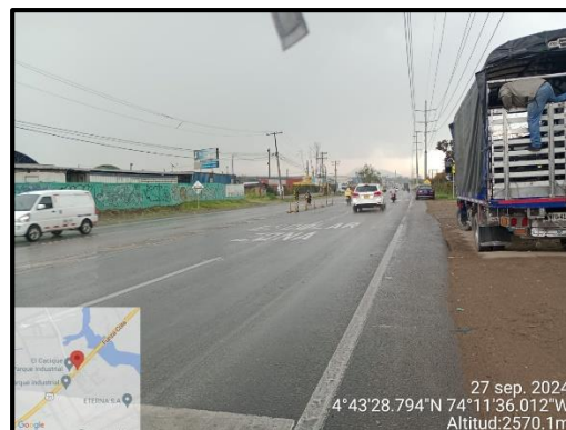
Ilustración 3. Evidencia recorrido, punto 3.